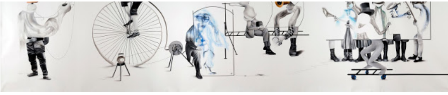
Panorama 3 (2014)

Tahran'da doğdunuz, ikinci üniversitenizle birlikte İstanbul'da yaşamaya ve çalışmaya başladınız. Sanatınızda İran ve Türk kültürü arasında nasıl bir sentez oluşturuyorsunuz?