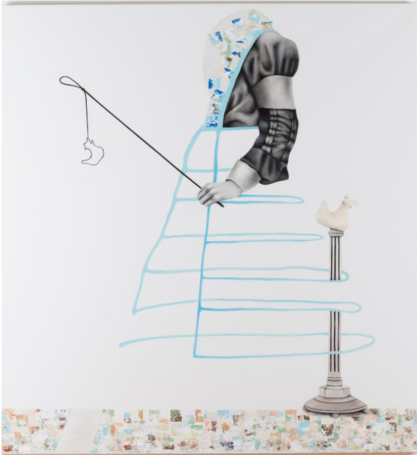
Bizim İsimsiz Kelebeğimiz (2015)

Zamandan ve mekandan bağımsız, bir anda ortaya çıkıp kendi başına varolabilen, herhangi bir hedefe ulaşmak için çabası olmayan figürler ve sahneler ilgimi çekiyor. Bu figürler ve izleri yolun sonunda bir yere varmayı beklemiyor, yolun içinde kaybolarak yaşamı tercih ediyorlar. İzleyiciye görünen de yaşadıkları süreçten sadece bir kesit.