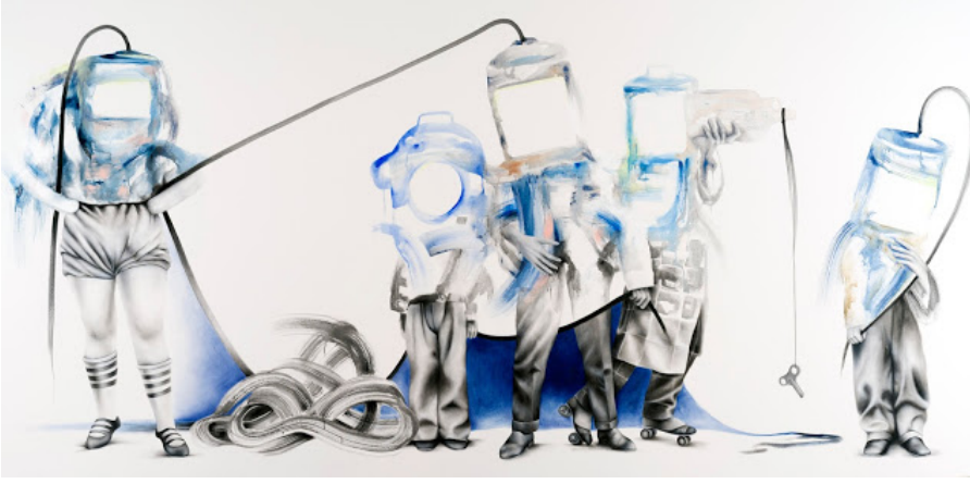
Kuş Gözlemcileri (2014)

Pek çok grup sergisine katıldınız, 2013 ve 2016 yıllarında olmak üzere iki tane de solo sergi gerçekleştirdiniz. Grup sergileri ile solo sergiler arasında nasıl bir tansiyon, adaptasyon ve bilinç farkı oluyor?