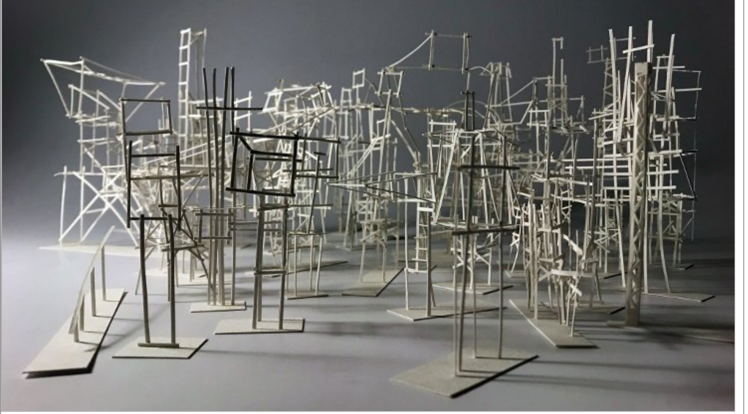
Nermin Er, İsimli, 2018, 15x25 cm, 120x50x22 cm, Kağıt üzerine kağıt enstelasyon (detay)

Çoğalan damlanın doğrulduğu yön. Lekeyi aktararak. Aştığı engel taşıyıcının kendisi. İncelerek her incelen yerden yüksek, yerden yüksek. Hafif bir uçuş, değen ayaklarıyla geride bıraktığı boş mekanlar, yollar, çarpışan köşeler, buluşan köşeler. Seyirme hali. Yıkıldı yıkılacak, içe bakan bir görüntü. Çerçeve çoğul, üst üste, kendine doğru. Eksilen boşluk. Yığın. Nermin Er.