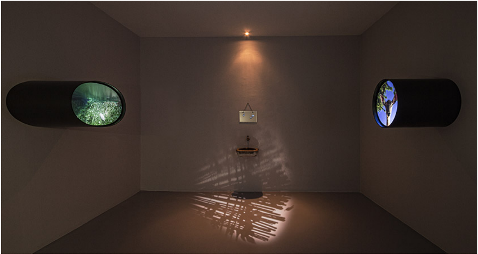
Hale Tenger, Rüzgârların Dinlendiđi Yer , 2019; sergi görüntüsü

Kendimi öyle buldum, plan programla deđil, kendiliđinden oldu. İimden gelen sesi dinledim, durdurmaya alıřmadım kendimi. Bunun için sanatı oldum sanırım. Bana bir nefes alanı yaratıyor. Küükken İzmir’de oturduđumuz mahalledeki en yakın ilkokula gittim, o muhitin karışık yapısını yansıtan, farklı ekonomik katmanlardan gelen ocukların olduđu bir okuldu. Apartmandaki diđer tüm ocuklar ise uzak bir ilkokula gönderildiler aileleri tarafından. Ben o ocuk gözümle okulda řunu anlamıştım: Ekonomik durumu kötü olan ocuklar bir de iyi bir öđrenci deđillerse hocalar tarafından itilip kakılıyorlardı. Derslerinde pek bařarılı olmayan, ama ekonomik durumu iyi olan ailelerin ocuklarına ise dokunulmuyordu. Bunu görmüřtüm. Sonraları hep iyi ki annem babam beni o okula yollamışlar diye düşündüm. Sınıf farkını bu kadar net başka bir řekilde öğrenemezdim. Belli bir kararla “ben řöyle bir sanat yapayım” demedim.