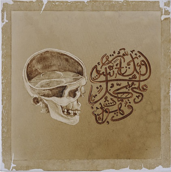
İsimsiz, 2018; tuval üstüne suluboya, 40x40 cm.