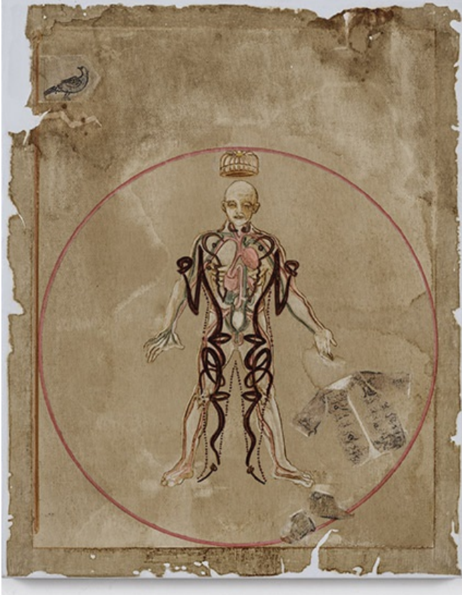
İsimsiz, 2018; tuval üstüne suluboya, 50x40 cm.

Kelimeler çok şanslı belki bu dilde; zafiyet ve izafiyet kelimeleri aklıma geldi... Her şey kendi içi ve dışında o kadar görünür ki, tüm mesele zihinle ilgili, değil mi? Bunun gibi, 'espas, suret' der geçeriz ama, o suretin de aslında bir 'asıl'ı gizlediğini nadiren biliriz. Sadece suretini edinmeye çalışırız... Bu da bizi sahiplik meselesine götürüyor... Kendi eserini ne zaman terk ediyorsun?