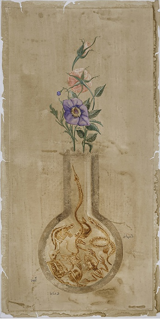
İsimsiz, 2018; tuval üstüne suluboya, 100x50 cm.