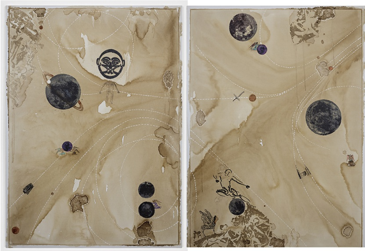
Murat Morova, İsimli, 2018; tuval üstüne suluboya, 180x260 cm.