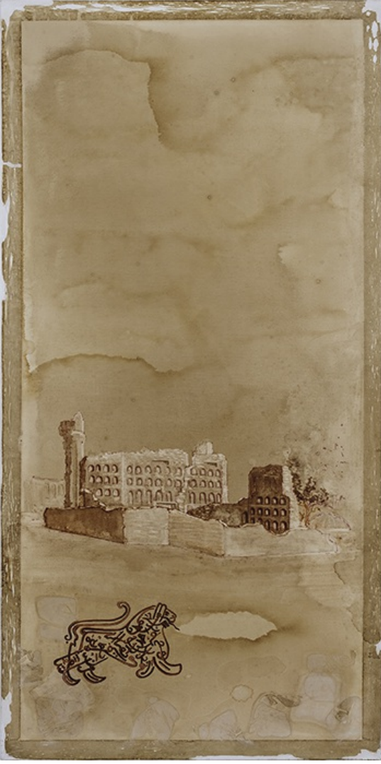
İsimsiz, 2018; tuval üstüne suluboya, 100x50 cm.

Kendi yaşlılığı da, yarası da var, kendi hafızası da var. Hem mânâ hem madde olabilen bir fenomenin peşinde, bir arayüzsün. Hiçbir tarafta değil, ancak bir 'araf'tasın.