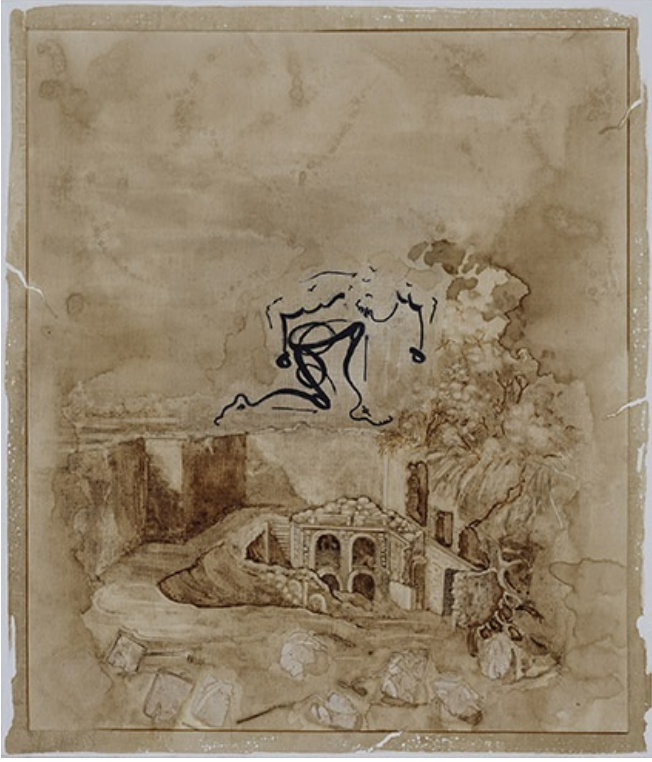
İsimsiz, 2018; tuval üstüne suluboya, 70x60 cm.