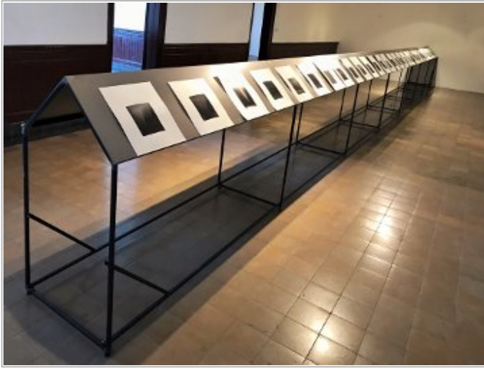
Günler, Kağıt üzerine suluboya, her biri: 34 x 39 cm, 2016-2017