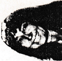
Hazırlayan: Rengin UZ