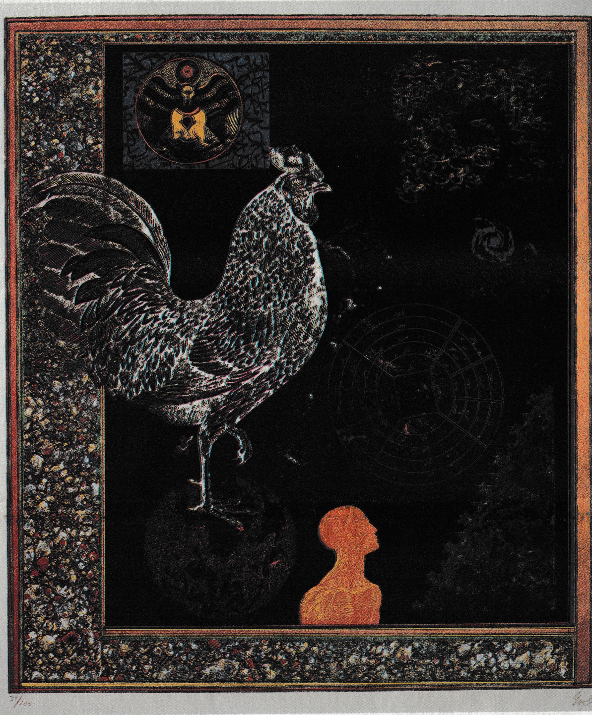
Erol Akyavaş, "Miraçname", taş baskı, 65x55cm, 1987

Sonuç olarak, nasıl Batı resminin özünde Hıristiyan ikonografisi varsa