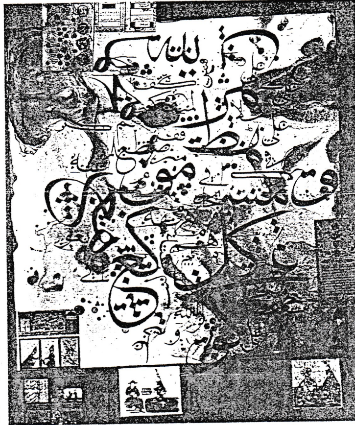
"Hem batın, hem zehir", 76x63 cm.