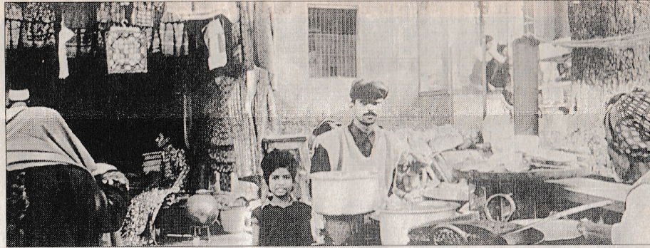
Akyavaş'ın yatay çekim yapabilen fotoğraf makinesinden, Hint halkı.

İki yıl önce yitirdiğimiz, aynı zamanda usta bir mimar olan sanatçı, bu fotoğrafları sık sık çıktığı geziler kapsamında gördüğü Hindistan'da çekmiş. Birçok fotoğraf arasından seçilen 28 çalışma, 30 Kasım'a kadar sürecek 'Öbür Dünyalarda' sergisiyle ilk kez sanatseverlerin karşısında olacak. Retrospektif sergisinde olduğu