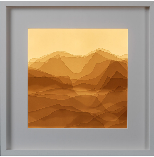
Nermin Er, Yol'da, Peyzajlar 2, 2022, Işıklı kutu ve kağıt rölyef, 52,5x52,5x6,5 cm.

Nermin Er'in 2018 yılında Galeri Nev İstanbul'da gerçekleşen bir önceki kişisel sergisi "Günler Üzerimize Yığılıyor", ağırlıklı olarak sanatçının heykelsi kâğıt işlerini bir araya getiriyordu ve bu sergide yer alan animasyon bir eskiz niteliğindedi. Bu sergide ise animasyon ve video başrolü alıyor, izleyici kağıtla lens aracılığıyla ilişkilenecek. "Işıklar Açılınca" bu anlamda sanatçının stop-motion animasyonla eskiye dayanan ilişkisinin sanat pratiğine daha doğrudan yansıdığı bir sergi.