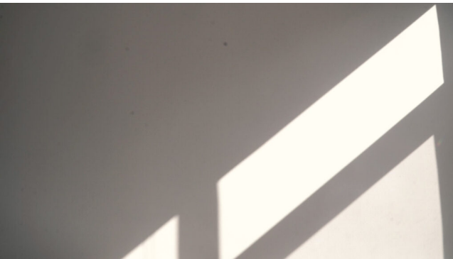
Nermin Er, Bir Akşamüstü Notları, 2022, Video, 6'51" (Video görüntüsü)

yapıyor ve bulutların arkasından çıkıp duvardaki yerini alıyor. Duvardaki bu ışık-gölge oyunu aşına olduğum gündelik bir manzara. Peki bu manzarayı doğal ışık almayan bir beyaz küp olan galeri alanına video aracılığıyla taşımak ne ifade ediyor? Nermin Er'in Galeri Nev İstanbul'da SENKRON kapsamında açılan altıncı kişisel sergisi " Işıklar Açılınca "nın girişinde izleyiciyi karşılayan yaklaşık 7 dakika uzunluğundaki bu durağan video aracılığıyla sergideki diğer yapıtları görmeden önce sanatçının atölyesinde zaman geçirme fırsatı buluyorum. Onun ışığın hareketlerini dikkatle izleyen gözünden, günlerini geçirdiği çalışma alanının duvarlarından birine uzun uzun bakıyor ve onunla beraber bu hareketlere dikkat kesiliyorum. Bu video, bir nevi izleyicinin bakma, görme, izleme alışkanlıklarını sergiye adapte ediyor.