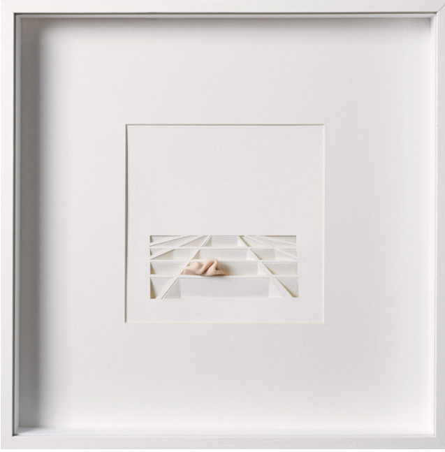
Nermin Er, Bir Akşamüstü Notları 6, Kâğıt üzerine kâğıt rölyef ve polimer kil, 42x42 cm.

deneyimleyebilmek ise çok keyifli. Video ile maket arasına yerleşen ve bu sergi için üretilen Peyzajlar serisi ise yoldan manzaraları donduran lightbox'lardan oluşuyor. Bu seri hem sergide yerleştiği nokta hem de sanatçının pratiğinde öne çıkan malzeme ve ışık gibi elementleri kullanımıyla kâğıdın olanak zenginliğini de gözler önüne seriyor.