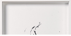
Nermin Er, Bir Kent Provası 5, 2022, Kâğıt üzerine mürekkep ve kumaş, 52×37 cm.

yola çıkıyorum. Yolda başlıklı 2013 yılına tarihlenen video çalışması, tatilin yolda başladığından hareketle hazırlanmış bir animasyon. Daha önce İstanbul Modern’de gerçekleşen “Lütfen Rahatsız Etmeyin” başlıklı sergide gösterilen bu animasyon, sanatçının hazırladığı bir mekanizma aracılığıyla kendi etrafında dönen dairesel maketin içinden çekilmiş bir yol videosu. Tatile giderken bir aracın penceresinden yolu izleme deneyimi yaşatan bu sarı-sıcak videoda ışığın güneşle ilişkili hareketi de ön plana çıkıyor: güneş önce yükseliyor, yol aldıkça batıyor.