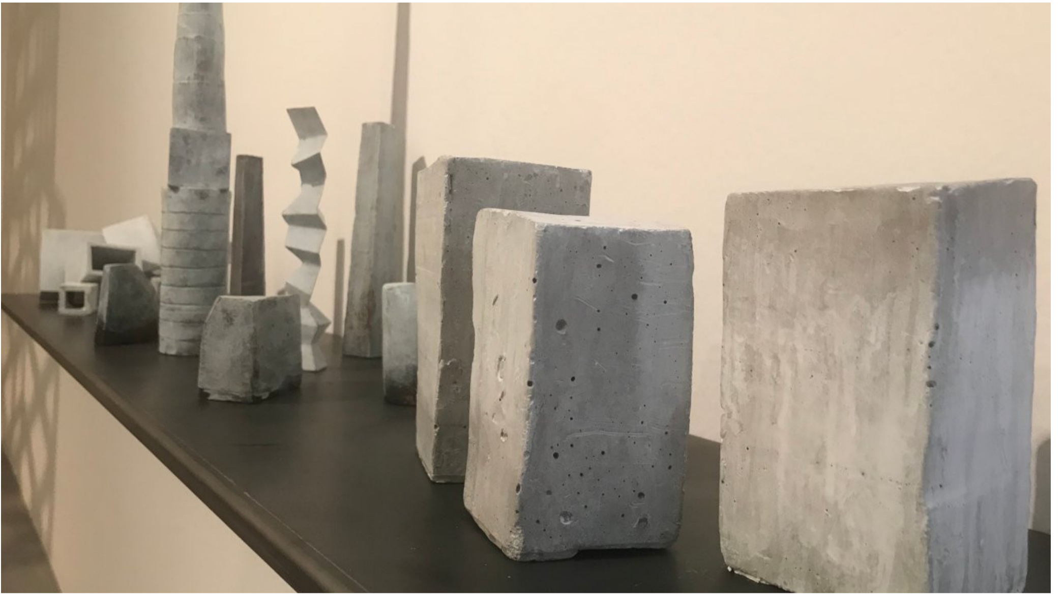
MIKE BERG, Modern Antique City on the Edge , 2022, Broz I Bronze, Değişken boyutlarda I Dimensions variable

Yapıtlarınızın ve haliyle de sizin kendi içlerinde düştükleri bu meta-fiziksel varoluş bunalımının ortaya koyduğu bu yaratıcı çatışmalar, gerçekten de sempati uyandırıyorlar.