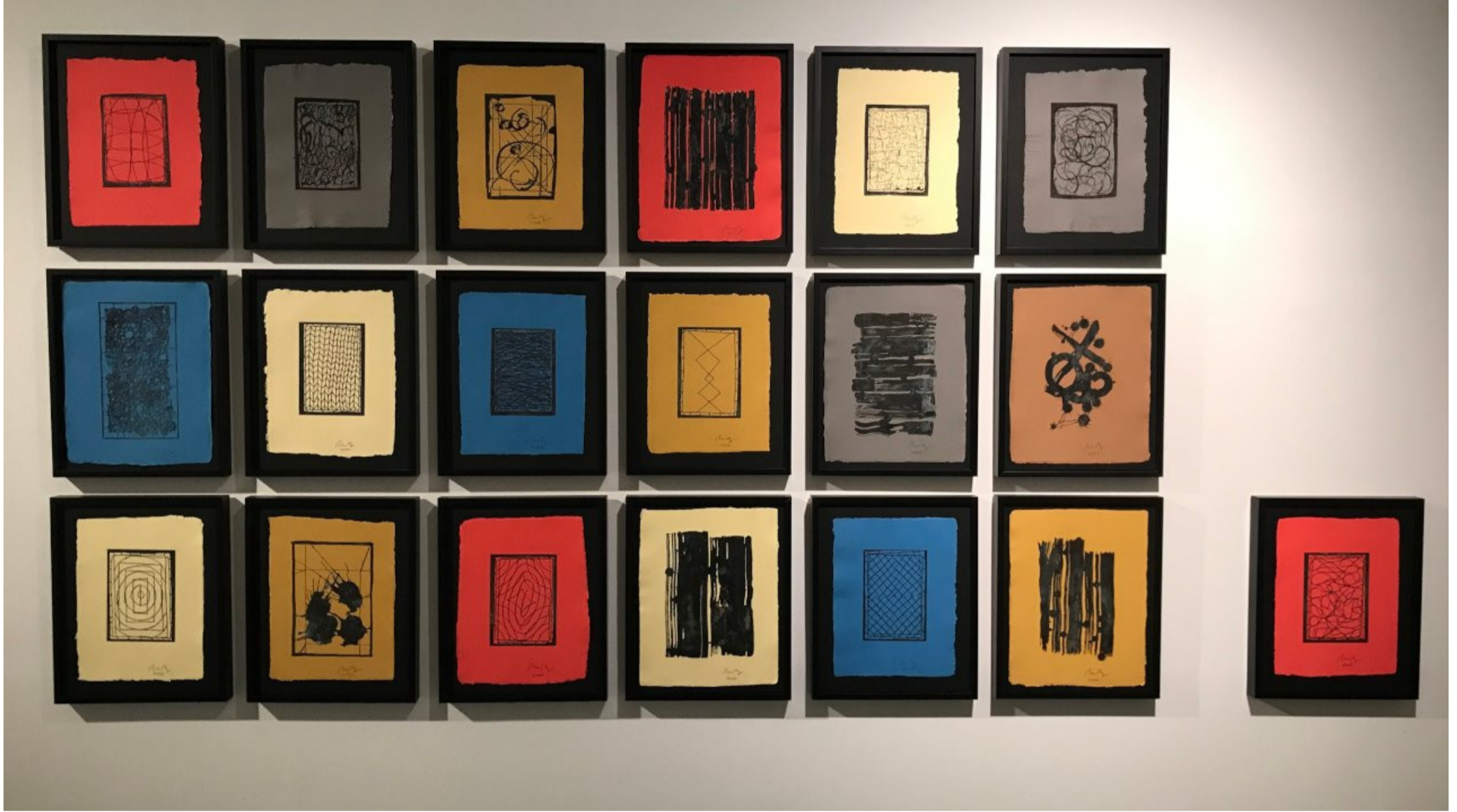
MIKE BERG - Evolution of Bronze, 2022, El yapımı kağıt üzerine bronz baskı I Bronze, embossed on handmade paper, 33x24 cm, Framed: 41x33 cm

Eserlerini nadiren yok eden biriyimdir. Ama, New York'taki 'depo'ya birkaç sene uğramayıp da, orada bulunanlarla yeniden ilişkiye girdiğimde ise, onlardan kurtulurum. Üzerinde çalıştığım şeylerden kurtulmayı seçtiğimde ise, bu onları değiştirmedim anlamını taşımaz. Öyle ki, onların benden bir nevi sabır, zaman talebinde bulduklarını hissedirim. Kimini yatak odamın duvarına asarım, desen sürecinde ertesi gün tekrar ilgilendiğim olur; duvarlarda konuk ederim, oturma odasında, yemek yerken, hatta bir diziyi izlerken bile civarımda tutarım. Ardından yine klişe gelecek biliyorum belki ama yapıtlarım üzerine çok sık hayal de görürüm. Bu benim yaşadığım sıkıntılara dair yansıttığım çözümlerden sayılabilir. Bir nevi yarı bilinçli halde bunları tecrübe ettiğim olur.