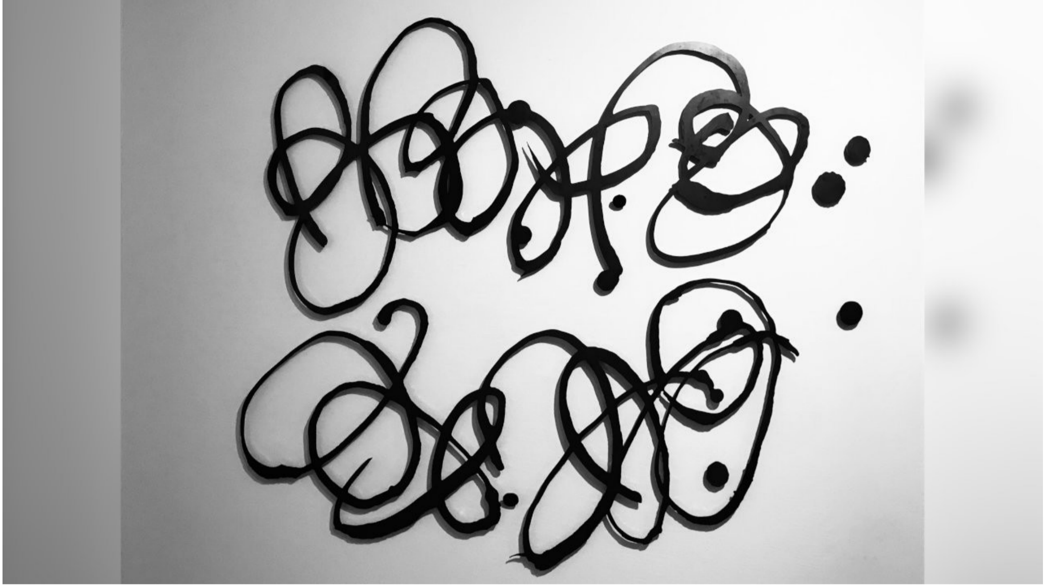
MIKE BERG - İsimli / Untitled, 2016, Demir / Iron, 180x180 cm

O.Gehry'den, kendisi pek hazzetmiyor. Sözelimi İspanya'daki Guggenheim Bilbao yapısını bir 'heykel' olarak kabul edecek olursak, harikulade. Tamam. Ama pratik bakımdan, bilemiyorum. Kaldı ki henüz gidip kendi gözlerimle de görmüş değilim. Yalnızca fotoğraflarından biliyorum; Haldun ise orayı ziyaret etme fırsatını yakalamış. Kendisi de oranın bir heykel olarak iyi çalıştığını, ama bir mimari yapı olarak aynı fikirde olmadığını düşünüyor.