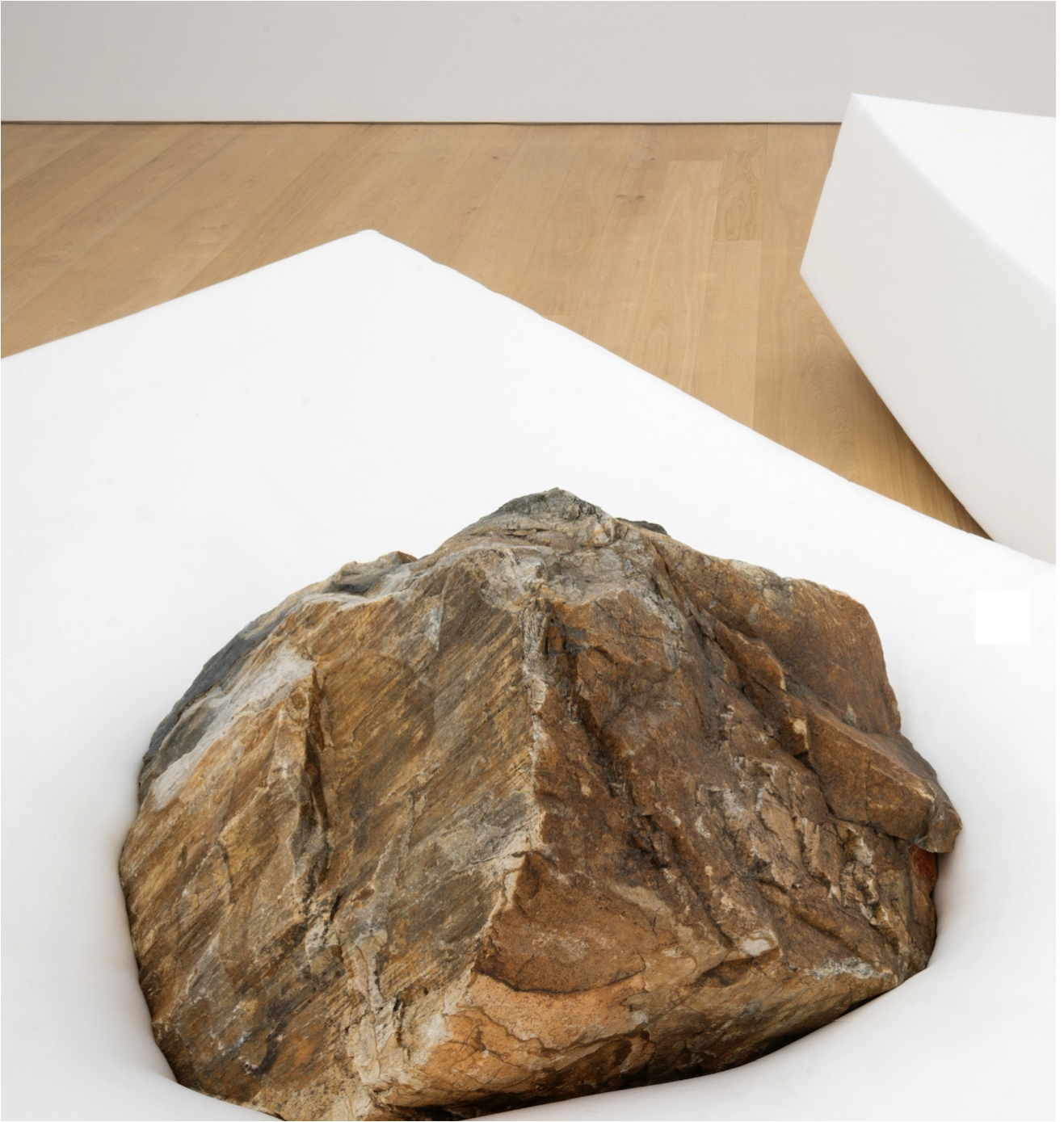
Bu iki fotoğrafta yerleştirmede kullanılan süngerlerin zamanla beyazdan sarı rengine döndüğü görülüyor.