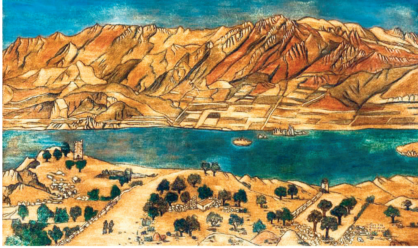
Arture 564, Georg Büchner ve J. M. Reinhold Lenz 2002, Kağıt üzerine karışık teknik, 30x50 cm

Röportajın devamını gazeteoksimen.com'dan okuyabilirsiniz.