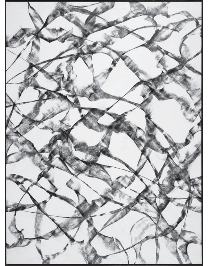
İz Serisi 2023, Tuvale marufle kağıt üzerine grafit kalem

dair şu cümleleri yazmışım: “Düşüncenin çoğaldığı bir yer olarak Akagündüz resmi; doğaya ve akışa teslim olmuş, sanatçının, kendi yeryüzünü de bu akışa teslim ettiği bilinç dışı bir örgütlenmedir.” Akagündüz bakışını ve bedenini