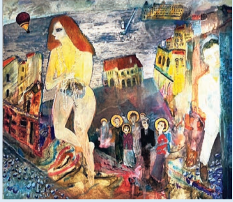
Matmazel N'nin Ayyıp Düşleri 190x220 cm

Dünyanın herhangi bir kentinde bu kadınlar, bu figürleri görebilirsiniz. Biraz İstanbul kokusu da var tabii. İstanbul'un sokakları, denizi, rüzgarı, yokuşları... Sıklıkla Kadıköy karşımıza çıkıyor. Çocukluğumda Kadıköy'de çok sıkıntılı günler geçirdim. Her hafta pazar günleri ailece akraba ziyaretine gitmek zorundaydık. Herkes ortalama 50-60'lı yaşlardaydı. Ben de 5-6 yaşlarındaydım. Konuşabileceğim, oynayabileceğim hiç kimse yoktu aralarında. Bu pazar sıkıntısı, Kadıköy sıkıntısıyla birleşiyor. Pazar günlerinin de bir sıklığı vardır benim için. O sıkıntıları düşlerimde de yaşadım. Bunları karıştırıp boyalarla anlatmaya çalıştım.