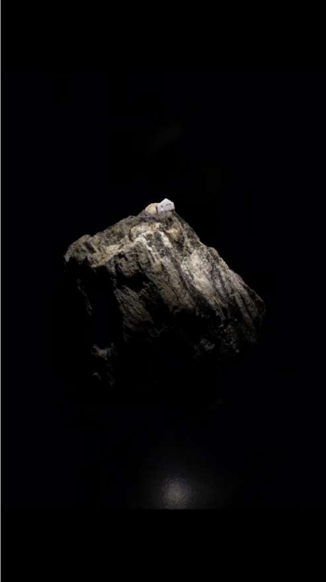
Aynı Anda Başka Bir Yerde, 2015 Karışık teknik 130x30x30 cm