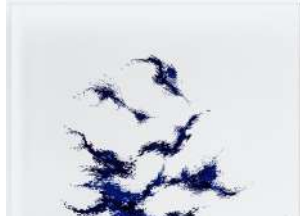
Gökyüzü Notları 6, 2022 Kağıt üzerine mürekkep, 72x52 cm