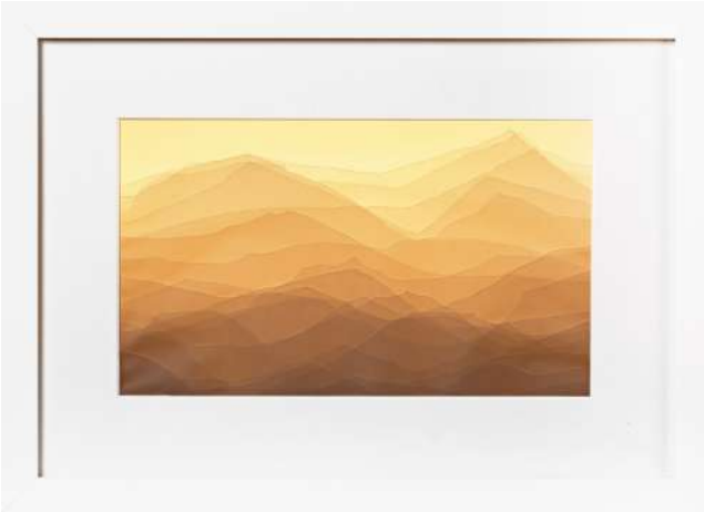
Yol'da, Peyzajlar 6, 2023, Işıklı kutu ve kağıt rölyef, 40x55 cm

enstalasyonlar bir araya gelerek çift yönlü bir okuma sağlanıyor. Aydınlık ve karanlık ikiliğini 2022'de Galeri Nev İstanbul'da gerçekleştirdiği Işıklar Açılınca adlı kişisel sergisinde de kapsamlı şekilde yansıtan sanatçı, ışığa duyulan ihtiyaçla birlikte karanlıkta olmanın konforunu, gerçeğin kendisiyle yüzleşmekle ondan saklanma eğilimi arasındaki çelişkiyi son derece güçlü bir etkiyle sunmuştu. Hatta 2004 yılından bugüne dek gerçekleştirdiği tüm eser grupları ve sergilerinde izlenebilen bu ikiliğin, görsel dilinin oluşumu ve gelişiminde büyük bir denge sağladığını söylemek mümkün.