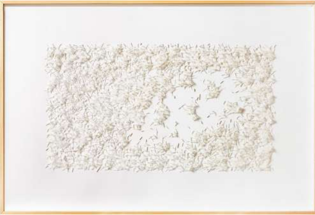
İsimsiz (Günler Üzerimize Yığılıyor), 2023 Kağıt rölyef, 82x124 cm

seçilebilecek kent peyzajları veya mimari kesitler; havuzlar, merdivenler ve trampelenler, mikro sahneler veya sade bir renk kullanımıyla, çizgilerle açılan kesikler ve derinlikler, kimi zaman da yalnızca yüzeyin dokusuna vurgu yapan jest ve müdahaleler dikkat çekiyor. Kâğıtların bu zengin dünyasında sanatçının görsel dilini yansıtacak çoğu detay, çok parçalı simetrik veya karışık gruplar halinde aralarındaki ilişkiler de gözetilerek sunuluyor. Kâğıtların arasında stilize ve mimari özellikleriyle ön plana çıkan duvar ve zemin heykelleriyse, dikey ve yatay alanlar ile hacim ve silüet arasında dengeli bir bağlantı kuruyor.