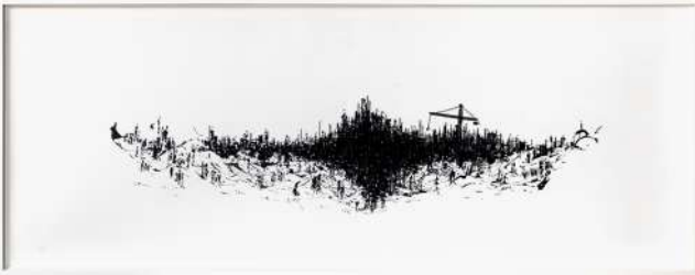
Karşılaşmalar 8, 2023 Kağıt üzerine kağıt rölyef ve mürekkep, 50x132 cm