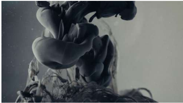
Mürekkep, 2017, Tek kanallı video, 2' 14"

Her yeni günün peşinde, "Sırada ne var?" sorusuyla koşarken ve bitmek bilmeyen bekleyişin içinde belirsiz bir geleceğe dair hayaller kurarken, çoğunlukla günlerin bize sunduğu küçük fırsatların farkına bile varamıyoruz. İçinde bulunduğumuz hız ve yorgunluk çağında, sokakta görebileceğimiz bir detay, dikkat