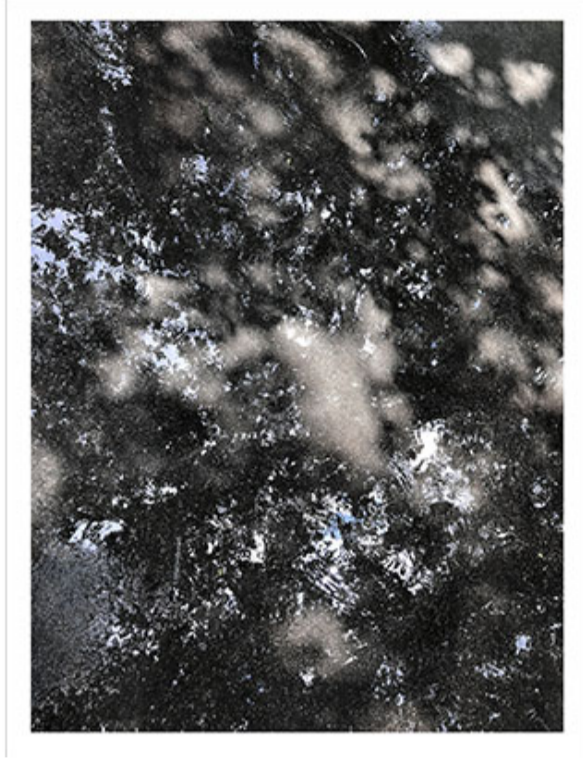
"Dark Matter", "Kara Madde", series, Untitled_Nr.6571, 2019, 151x116cm, C-print.