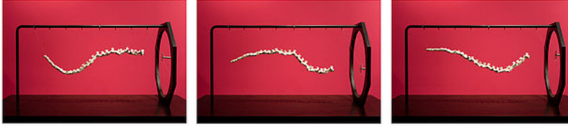
Gökçen Dilek Acay, Hayali Hayvan I, 2016, Metal, ahşap ve porselen, 51x150x80 cm.

Acay çalışmalarını evladiyelik sanat objeleri olarak sınırlamak ve sergilemektense onları günümüze taşınmış arkeoloji veya doğa müzesi parçaları olarak sunuyor. Çalışmalarındaki her ögede bir canlılık ve hayatın içindenlik hissi bulunmasının sebebi de bu olsa gerek. Acay çalışmalarında organik ve inorganığın, hareketli ve cansız objelerin iç içe geçtiği bir oyun alanı yaratıyor, hayvanları simgeleyen nesnelere mekanik detaylar katıyor.