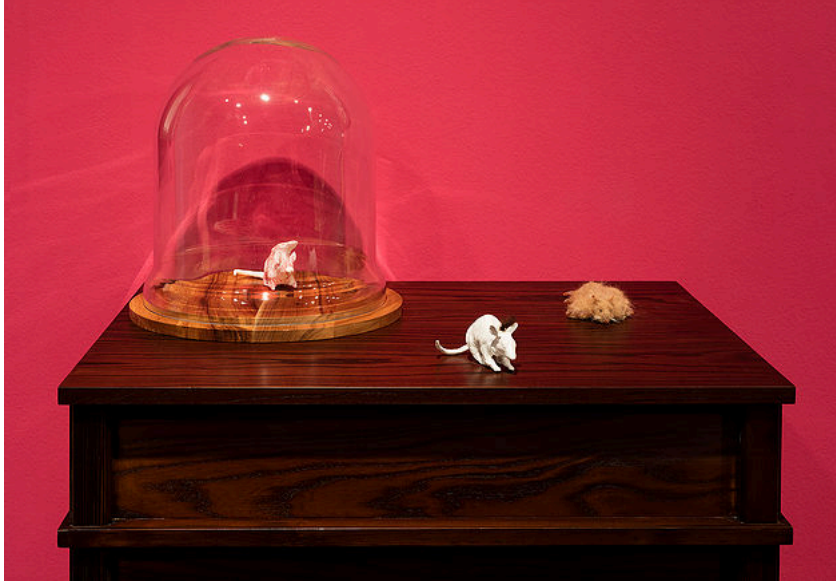
Gökçen Dilek Acay, Kobay Fareleri, 2016, Lateks, yapay kürk ve reçine, 95x80x60 cm.

Galeri Nev İstanbul, sanatçı Gökçen Dilek Acay'ın ilk kişisel sergisine ev sahipliği yapıyor. Gelecekteki İlkel başlıklı sergide, kapsamlı araştırmalarında odaklandığı, insan türünün ve gücün evrimi konularını, farklı mecralarda ürettiği eserlerinde bir araya geliyor. Saç, sabun, tıg işleme ve mekanik heykel gibi tekniklerle üreten Acay, organik ve inorganik, hareketli ve cansız objelerin iç içe geçtiği bir dünya yaratıyor. Seyirciyi bu dünyada insan var oluşunun başlangıcı, geçmişi ve olası geleceği üzerinde düşünmeye davet ediyor.