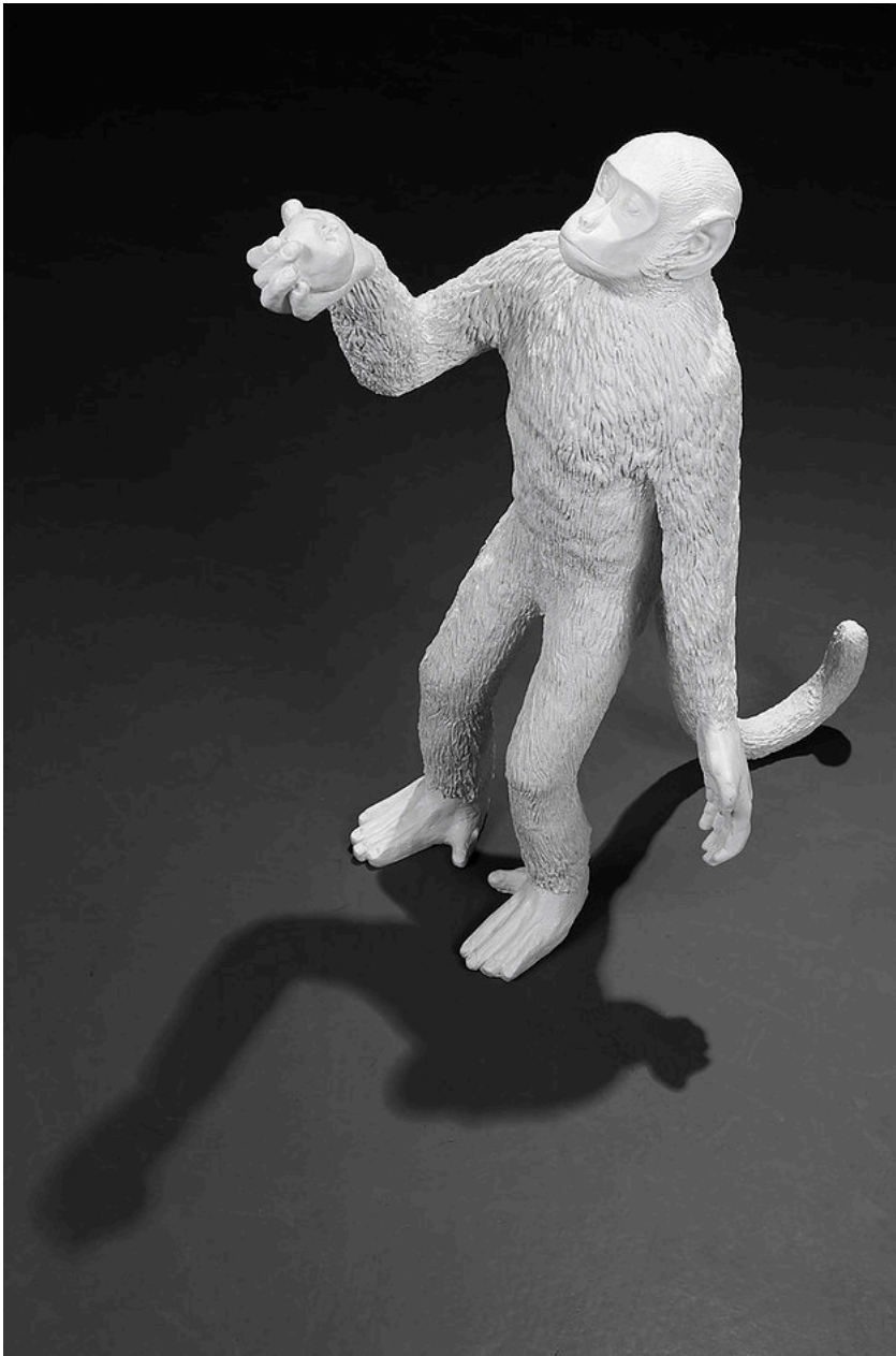
Gökçen Dilek Acay, Prolog, 2016, Fiberglass, Yükseklik: 72 cm.

Sabun üzerine saçlar ile çizilmiş iskelet biçimleri, deformasyona uğramış bedenler, deney hayvanlarına atıfta bulunan fare figürleri bizi uzak götüren yakın gelecekle tanıştıyor. Sanatçı, fosil ve kalıntıların erken dönemi çağrıştırmayı yargısını yıkararak baktığımız manzaranın geleceğin habercisi olduğunu düşünmemizi sağlıyor.