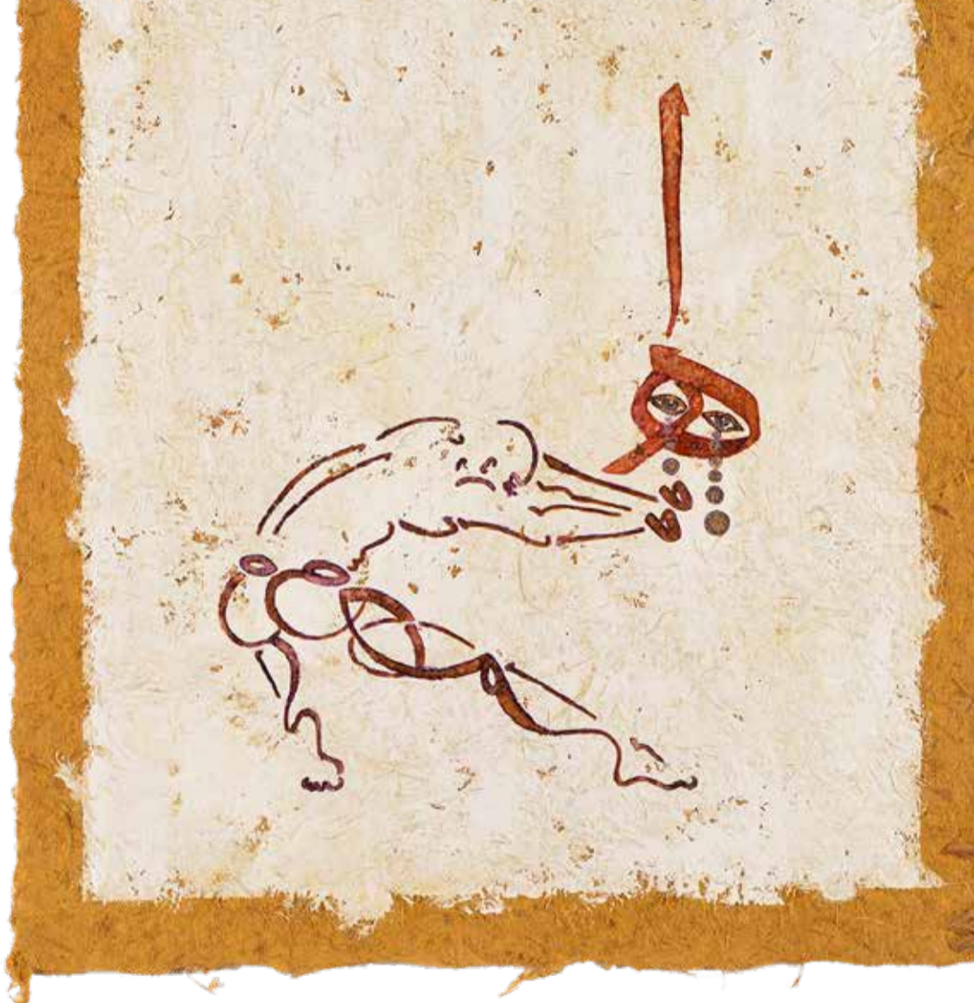
Murat Morova, simsiz , 2017 El dökmesi kağıt üzerine akrilik ve suluboya, 97x75 cm

Morova'nın üretiminde, Merleau-Ponty'nin de ifade ettiği gibi, algı olan biten her şeyin merkezindedir. Hem resimlerinde karışık imiz bedenler, hem de Morova'nın algılayan bedeni, performatif bir üretim dilinin kesime alanıdır. Bir bağka dediği gibi Morova, algılayan ve algılanan beden olarak hem şeylerin içindedir, onlardandır ve oradadır, hem de algıladı ı her şeyi bedene taşır. Bu örgüsel bir ilikidir ve Merleau-Ponty felsefesinin i aretlediği dünya ile beden arasındaki bağlantıdır. Kozmos ile kaos arasında algılayan ve algılanan, gören ve görünür olan kaligrafik beden, Morova'nın anlatısında bu iki ayrı edimin birbirini bütünleyen iki ayrı yüzü gibi karışımı çıkar.