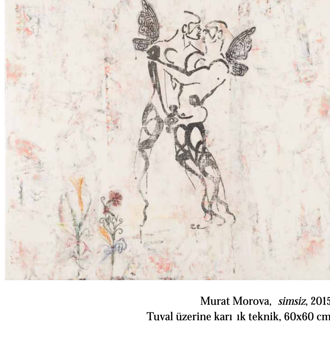
Murat Morova, simsiz , 2015 Tuval üzerine karı ık teknik, 60x60 cm

Sanatçının estetik pratiğinde temellük; kaligrafik bedeni köklerle, unutulmuş - la, sanat tarihiyle, edebiyatla, felsefeyle, müzikle bağlantıya sokar: Beden onda gerçekleştiren ve ona yönelen her şeyi, anın ve yerin gerçekliğinde örür. Bulunu alanında gerçekleştiren dünü ve geleceği sürekli hatırlatmazlar ama onlar hep vardır. Morova'nın algı deneyimi ve zamanla teması, döngüsel bir köullulukla birbirine bağlantı olarak ortak bir ufuk hattı, devingen bir atmosfer yaratır. Merleau-Ponty'e göre bu, "bedenin odaklandığı her harekette imdiyi, geçmişi ve geleceği birleştirmesi, zamanı salgılaması, daha doğrusu zaman tarafından ittirilmeden doğada ona yer olmasıdır." 3