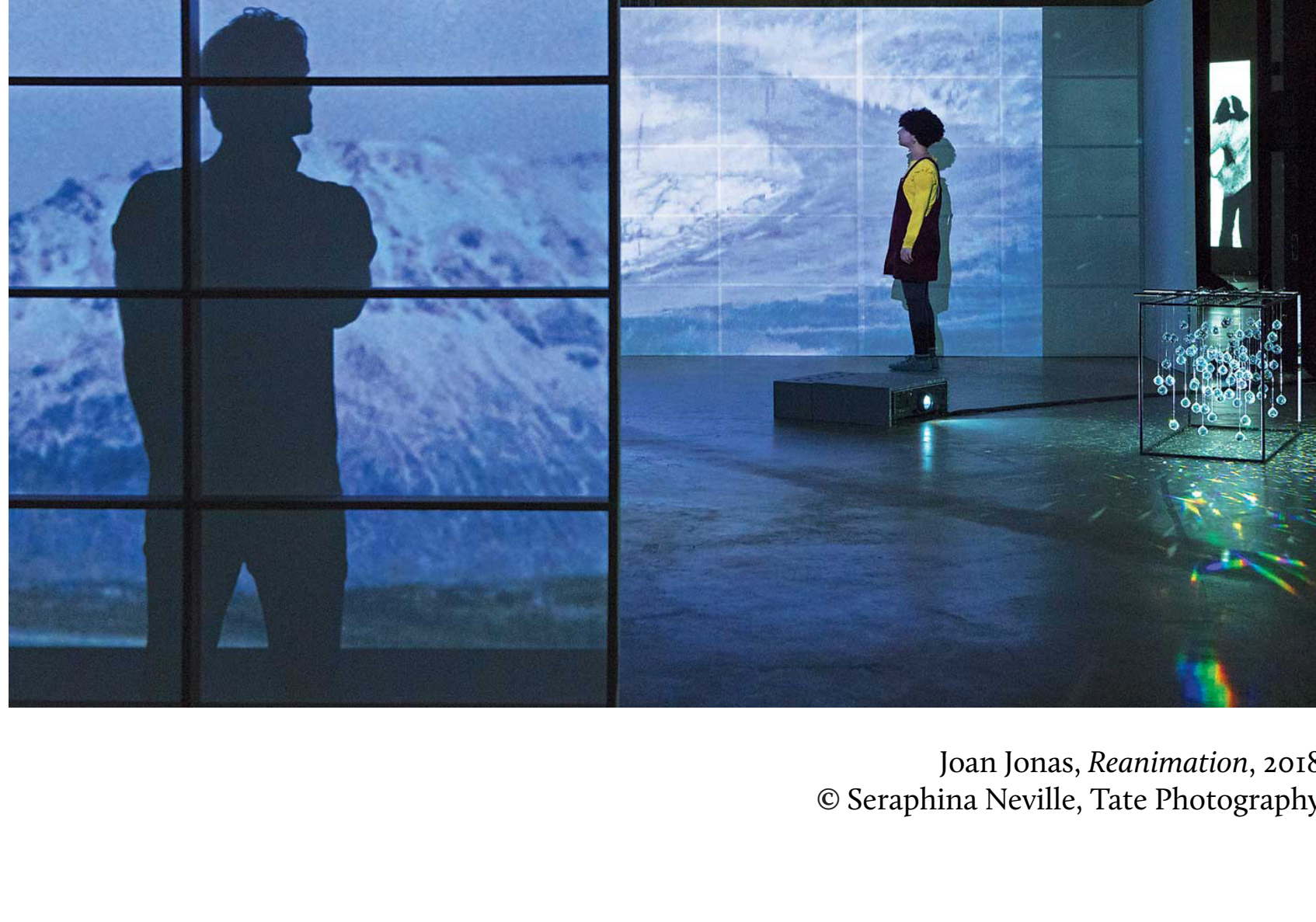
Joan Jonas, Reanimation , 2018