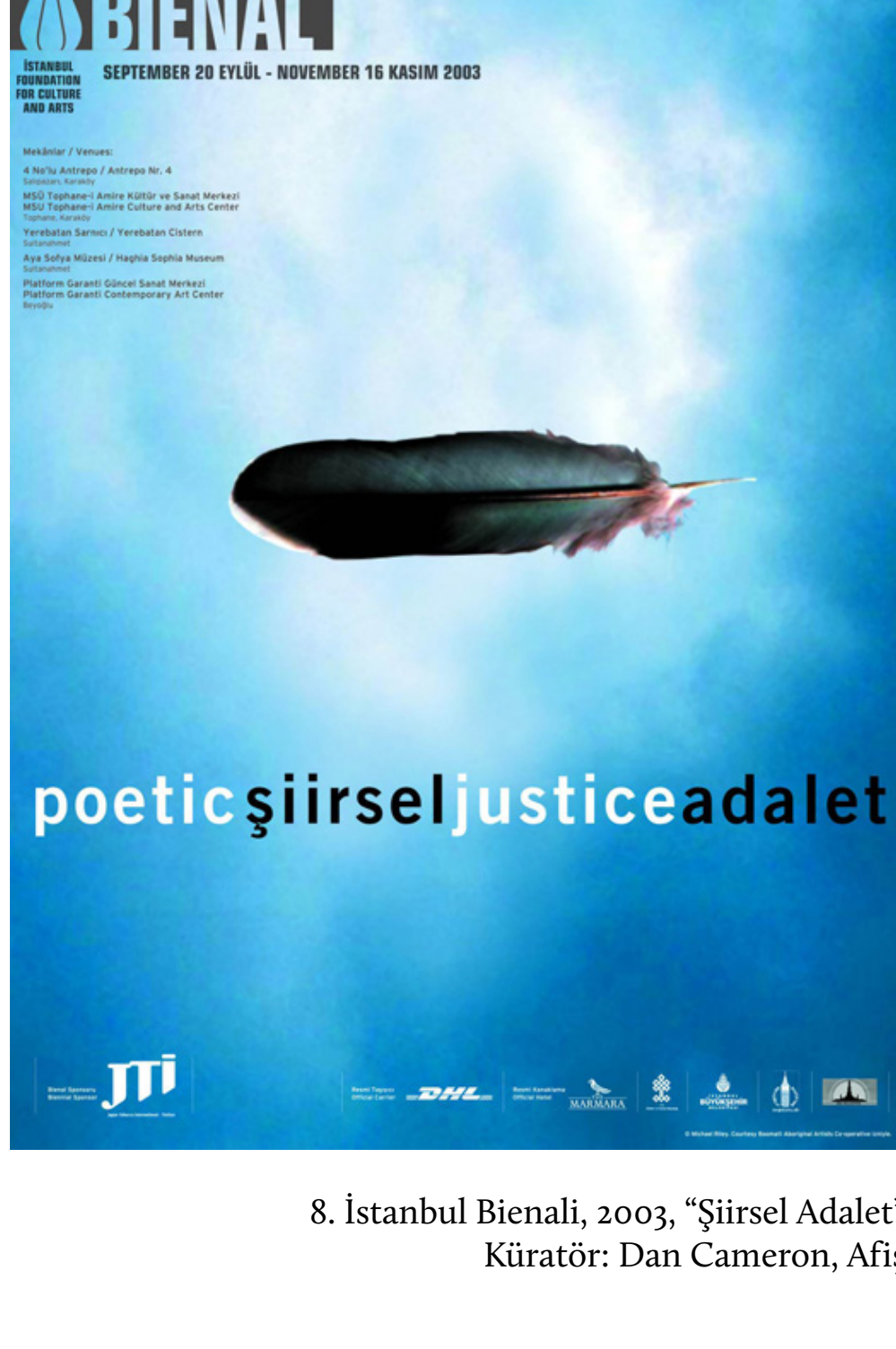
8. İstanbul Bienali, 2003, “Şiirsel Adalet” Küratör: Dan Cameron, Afiş

1990’larda çağdaş ve sonraki adıyla güncel sanat öne çıkarak sanat bileşkelerini değiştirdi; estetik teoriyle birleşen felsefe ve bilhassa sosyoloji, sanatın yeni bileşkesini oluşturdu. Bu anlamda özellikle Fransız modern felsefesi (Foucault, Deleuze-Guattari, Lyotard, Baudrillard, Derrida) ve sosyolojisi (Bourdieu, Maffesoli) sanat eleştirisiyle (Bourriaud ve ilişkisel estetik) yeni bileşkeyi İstanbul’da 90’lı yılların hemen başında kurabildi. Bu anlamda, bir İstanbul avangardından söz edebilirim. Toplumbilim dergisi de bu rolü üstlenmişti: “Sezgisel Sosyoloji” üst başlığıyla felsefe, estetik ve sosyoloji harmanlanmaya başlandı. Bu durum, İstanbul Bienalleri’nin de bir parçası olarak sanattaki dönüşümle aynı zamanda gelişti.