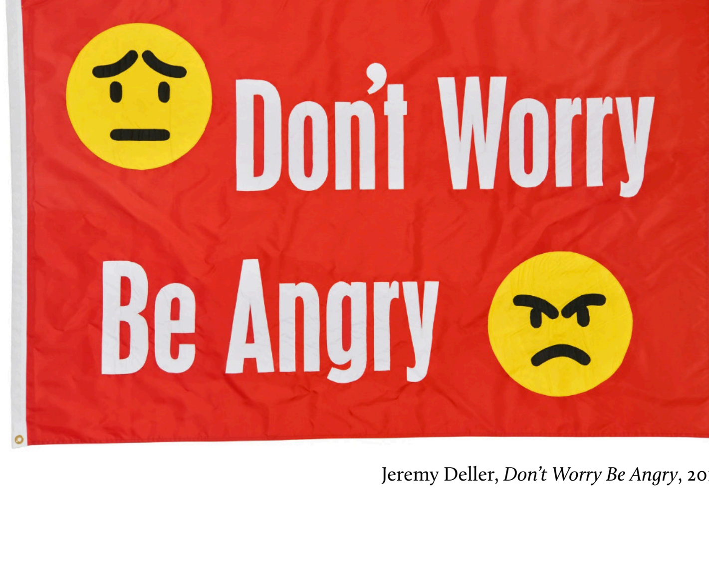
Jeremy Deller, Don't Worry Be Angry , 2017

Covid-19, bu krizleri yeniden tetikledi ve bunu en iyi görenler de sanatçılar oldu. Uzun zamandır arkada durdukları yerden görünür kılınmaya başladılar; ön plana gelip, kendi eserleri üzerine konuşmaya sevk edildiler. Atölyeler ve düşünceler yine görünür olmaya başladı. Dünya çapındaki galerilerin yaşadığı krizler sanat sayfalarında okunmaya başlandı: New York Times’da çıkan, sanatçıları arasında Joan Jonas, Urs Fisher, Ed Atkins, Y. Kounellis Estate, , Alex Katz, Jeremy Deller gibi isimlerin olduğu Gavin Brown Galeri’nin 26 yıl sonra kapanıp Barbara Gladstone ile birleşeceği haberi, yeni bir dönemin de habercisi mi?